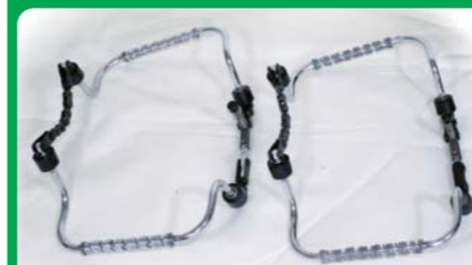
サイズによって2つ又は3つでセットです