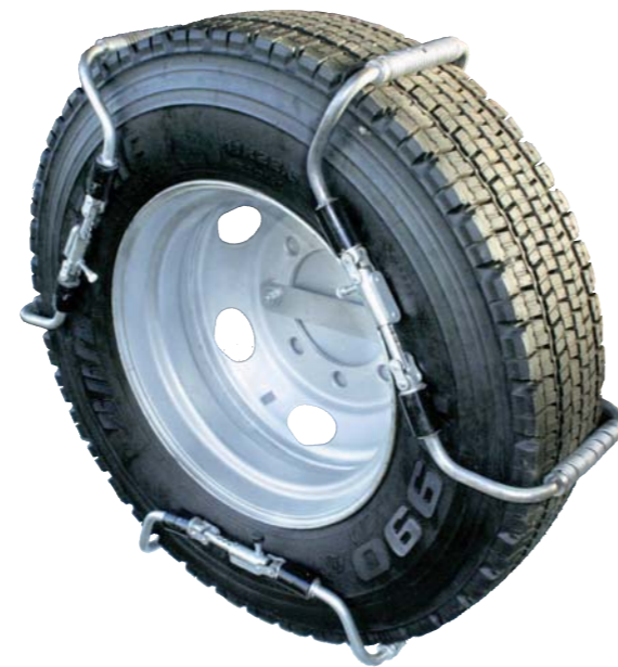
▲ 大型、中型、小型、トラック・バス用